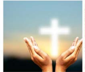
翻轉我人生的上帝

人財兩空，借酒消愁… 差點連生命也失去。在一次同學聚會中；遇上一位好姊妹；在相聚後；與她結伴到教會團契中，當天聽到路德和拿俄米的經卷，接著弟兄姊妹更隔天與我傾電話，又陪伴我都銀行處理重組債務；更鼓勵我約家人飲茶重建關係！